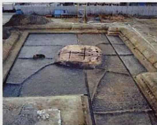
上：古墳のまわりに広がる水田（長吉長原2丁目）

難波にも都が置かれたこ の時代、長原では土地開発 が進みます。台地の上には 大規模な人工の水路がつく られ、広い範囲が水田化さ れました。低地を流れる川 からは、人面土器などのま つりの道具やウシ・ウマの 骨が多数出土しています。