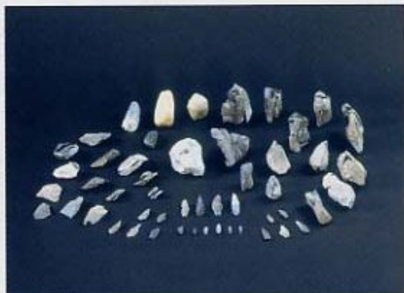
上：約1万7千年前の石器群（長吉六反1丁目） 左：赤い旗が石器。2万5千年前に南九州から飛来して降り積もった火山灰（AT火山灰）の下で発見。（長吉川辺3丁目）