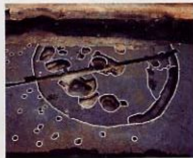
竪穴住居あと（長吉長原東2丁目）