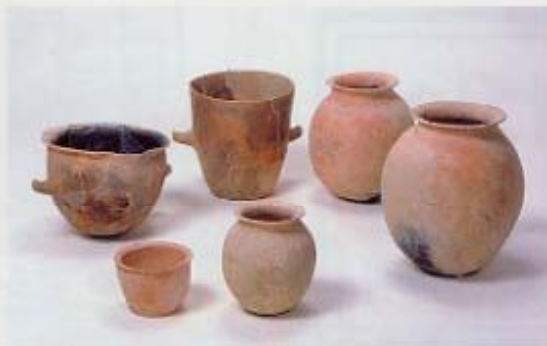
渡来人が使用した韓式系土器（長吉長原東1丁目）

古墳も多数見つかってい ます。現在は地中に埋れて 見ることはできませんが、 小型の方墳を中心に200基 以上が調査されています。 古墳には様々な形の埴輪が 立てられ、特に高廻り2号 墳出土の船形埴輪は、当時 の造船技術を伝える貴重な 資料として、重要文化財に 指定されています。