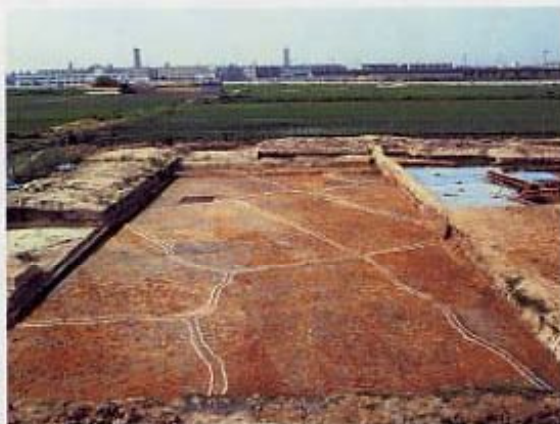
弥生時代の水田（長吉川辺3丁目）

米づくりが本格化し、ムラを治める有力者が登場します。長吉長原東1・2丁目付近には当時のムラが眠っており、 たてあびしゅうきょ 竪穴住居あとや ほうけいしゅうこうぼ 方形周溝墓が見つかっています。水の得やすい場所には水田がつけられました。