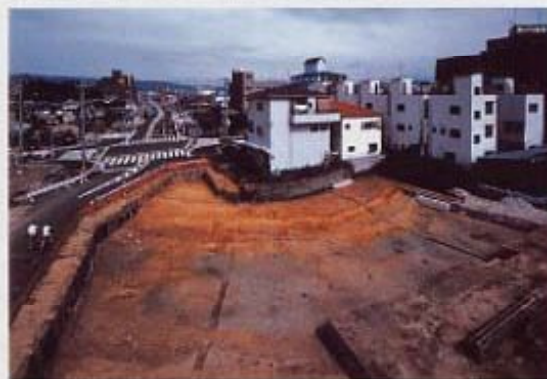
4世紀後半の円墳である一ヶ塚古墳（長吉長原西4丁目）