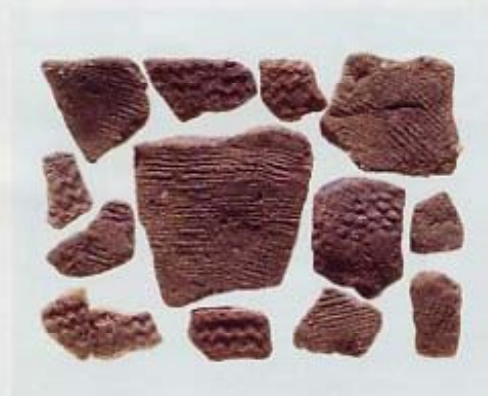
上：縄文早期の撚糸文土器・押型文土器（長吉六反2丁目）

温暖な気候になり、山・海の幸に恵まれた時代です。市内最古となる縄文早期（約8000年前）の住居あとや、晩期の住居あと・土器棺墓が見つかっています。晩期の土器は「長原式土器」と呼ばれ、弥生時代へ移り変わる時期のものです。