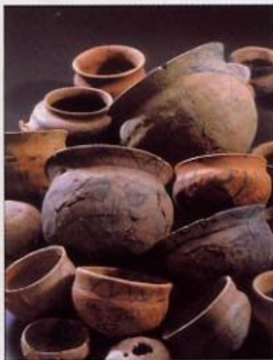
右：墨で顔が描かれた人面土器（長吉出戸8丁目）