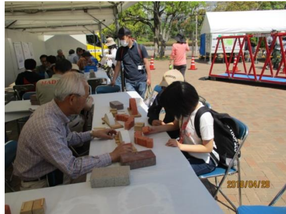
後ろにトラス橋が見えている