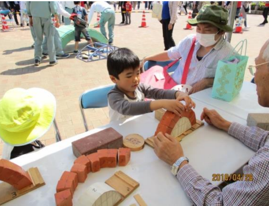
アーチ橋製作風景