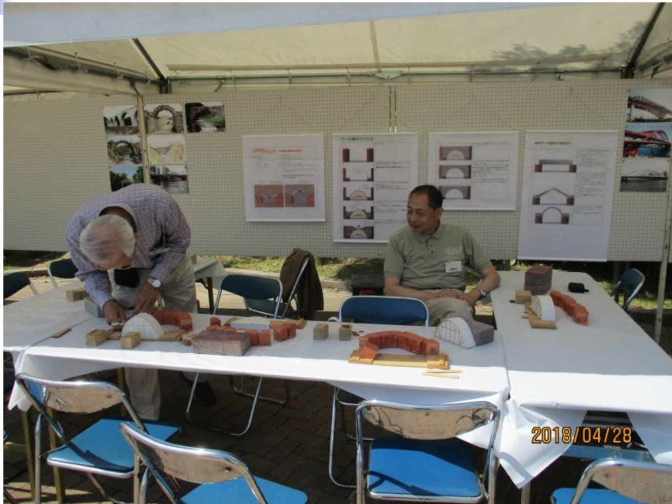
花のフェスタこうべ2018 出展ブースの状況写真